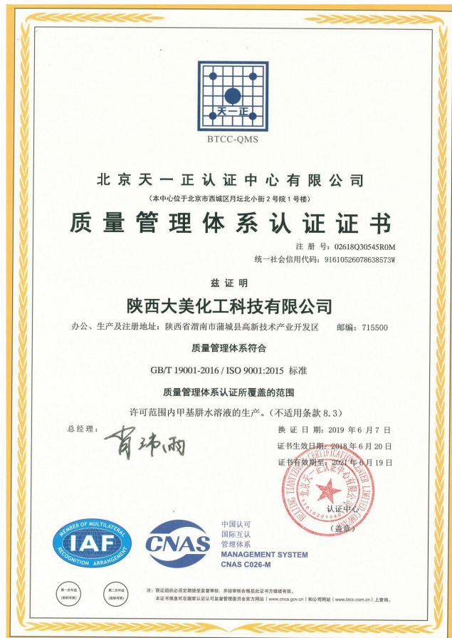
图 5-1 质量管理体系认证证书