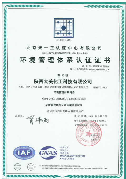
图 7-1 环境管理体系认证证书