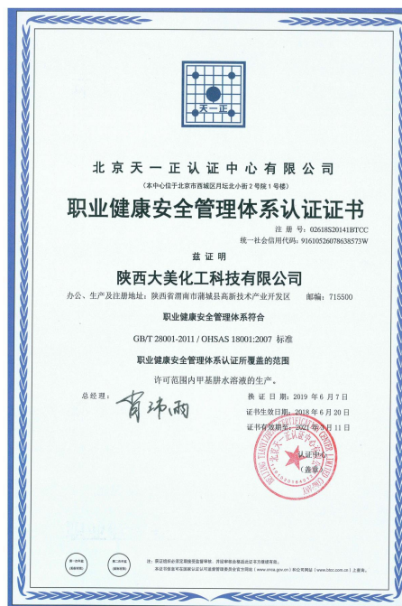
图 7-2 职业健康管理体系认证证书

体系:通过 GB/T 24001-2004 环境管理体系(图 7-1)、 OHSAS18001 职业健康管理体系认证 (图 7-2), 并持续运行。